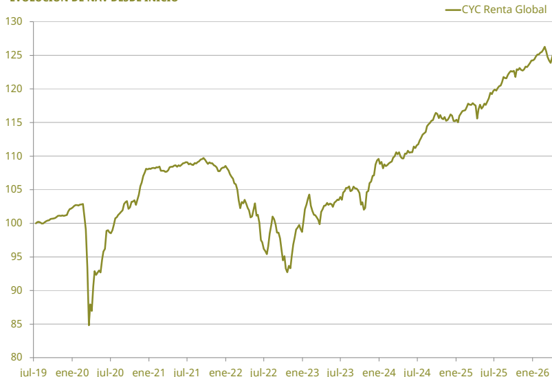
EVOLUCIÓN DE NAV DESDE INICIO